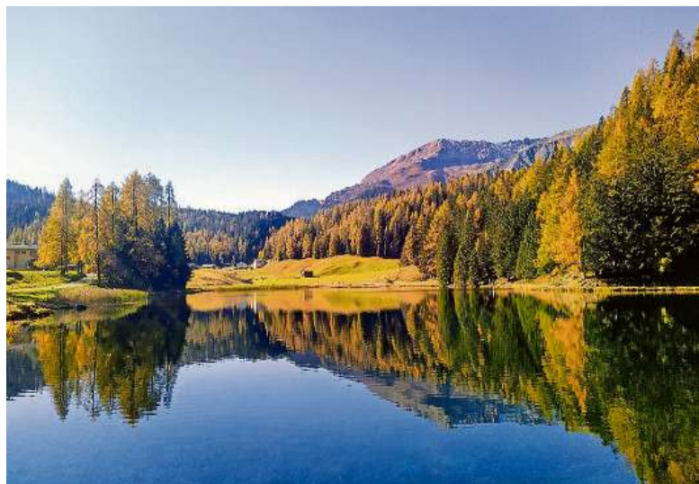
Davos Laret und Sunnibergbrücke vor Klosters.

Haben auch Sie, liebe Leserinnen und Leser, Ihren besonderen herbstlichen Lichtblick? Dann teilen Sie doch diesen Glücksmoment mit uns. Die besten Bilder werden mit einem Abdruck belohnt. Senden Sie uns Ihr Foto oder Ihre Fotos mit einer kurzen Legende dazu an die folgende E-Mail-Adresse: redaktion@buendnertagblatt.ch.