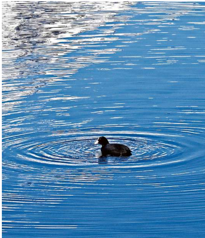
Soll Auftrieb schenken, im Zentrum zu sein. Arno Mainetti, Chur