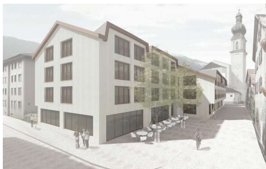
Projekt Alterswohnungen «Residenza Ensemen» mit neuem Platz an der Kreuzung Via Baselga/Gassa sudò.